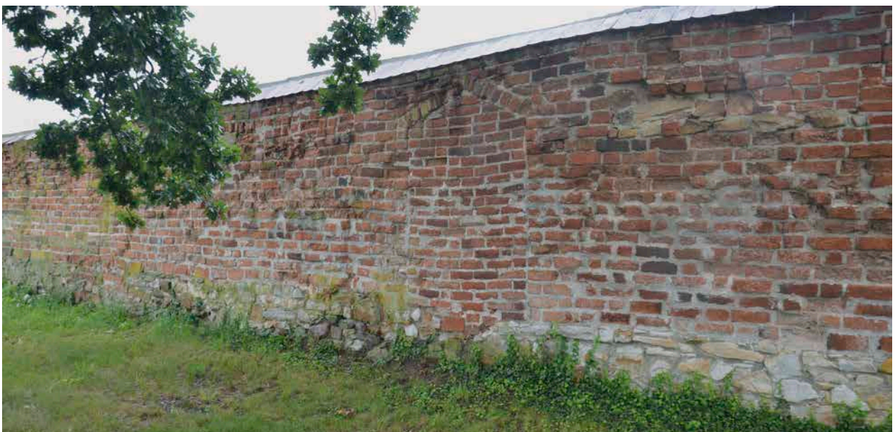
ABB. 1 Jerichow, südwestliche Klostermauer, Innenseite, Blick von Nordwesten (2020)