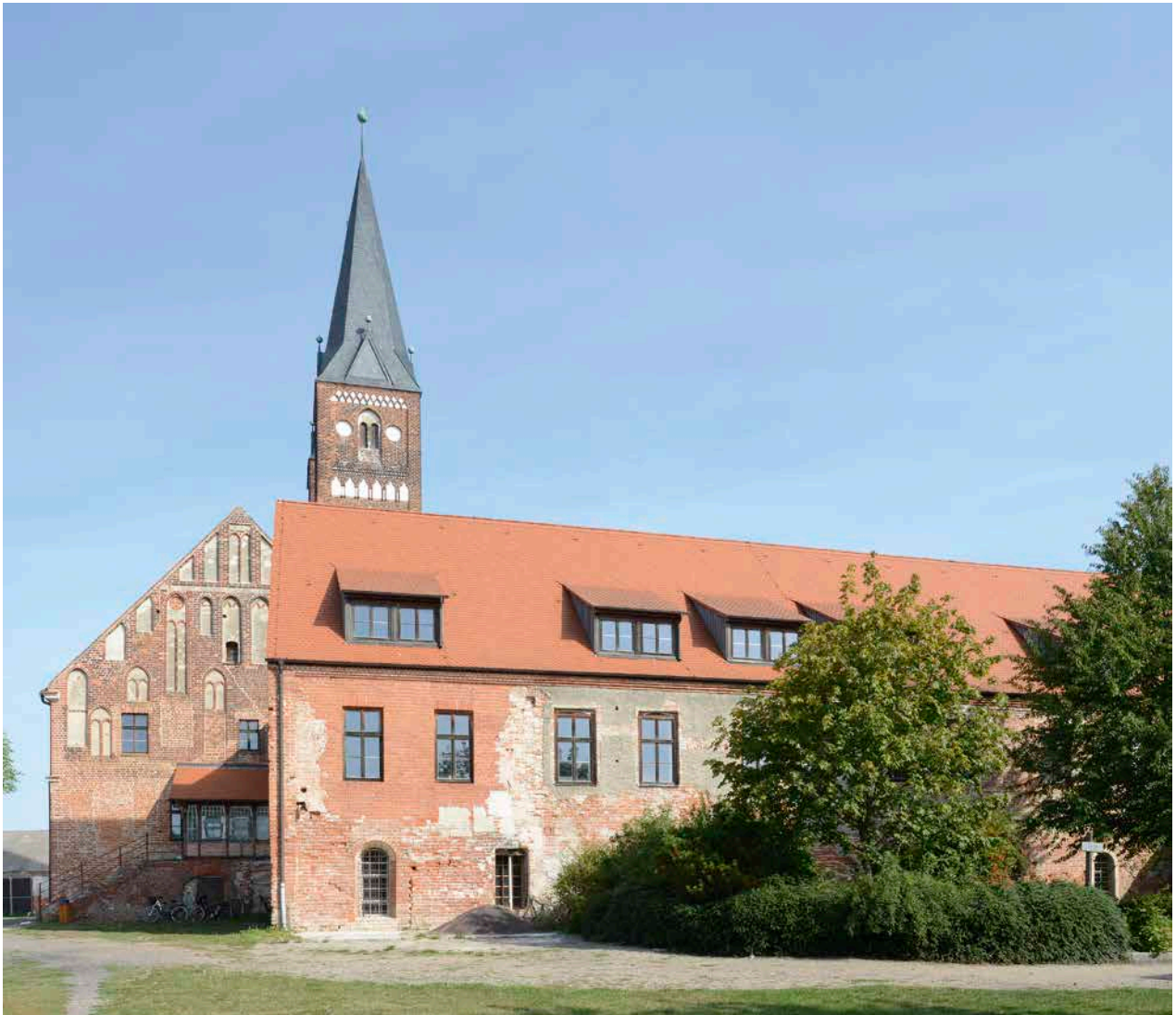
ABB. 4 Jerichow, Kloster, Ansicht von Süden

Falko Neininger hat jedoch in einer Arbeit aus dem Jahre 2007 zeigen können, dass die Gründung Gramzows mit großer Wahrscheinlichkeit von Ratzeburg aus erfolgte. 204 In diesem Zusammenhang sei auf das Prämonstratenserstift Temnitz hingewiesen, das 1224 erstmals genannt wird und zur sächsischen Zirkarie gehörte. 205 Es könnte, wie Hauck und Wentz vermuteten, im Temnitzgebiet gelegen haben. 206 Die wenigen Belege seiner Existenz datieren alle ins 13. Jahrhundert. 207 In der letzten urkundlichen Erwähnung wird bereits deutlich, dass das Stift keine Rolle mehr in der Zirkarie spielte. 208 Im 14. Jahrhun-