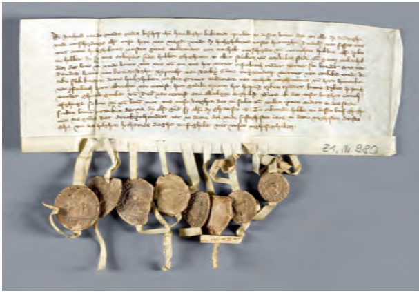
Abb. 4 Urkunde über die Beilegung des Konflikts zwischen Bischof Burchard II. von Havelberg und Fürst Waldemar I. aus dem Jahre 1363.