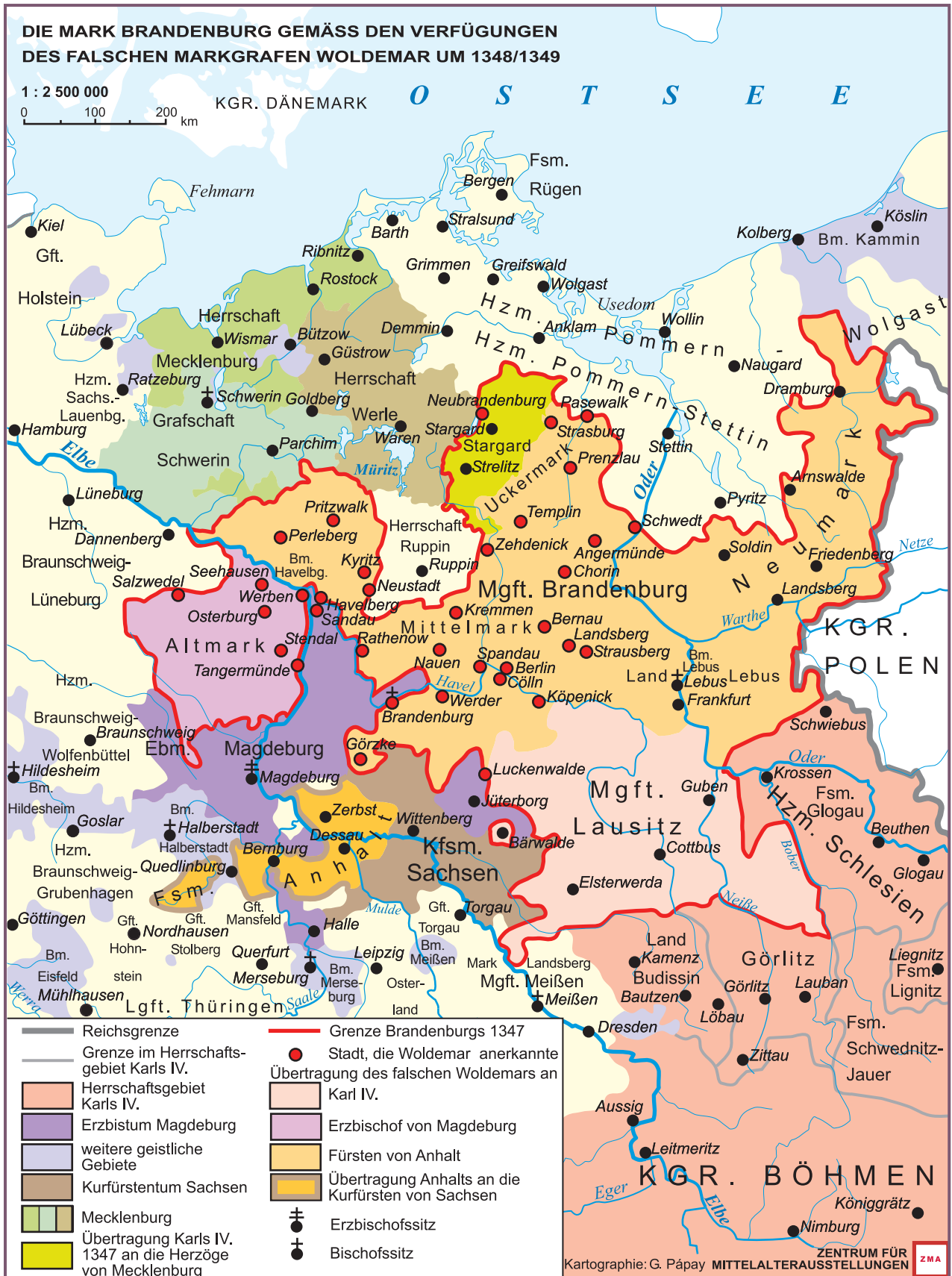
Abb. 3 Die Mark Brandenburg gemäß den Verfügungen des falschen Markgrafen Woldemar um 1348/1349.