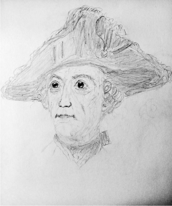
Friedrich der Große, Zeichnung von Lutz Partenheimer