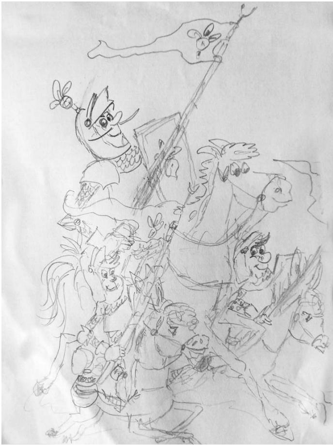
Ritter Runkel von Rübenstein mit seinen Knappen Dig und Dag, Zeichnung von Lutz Partenheimer