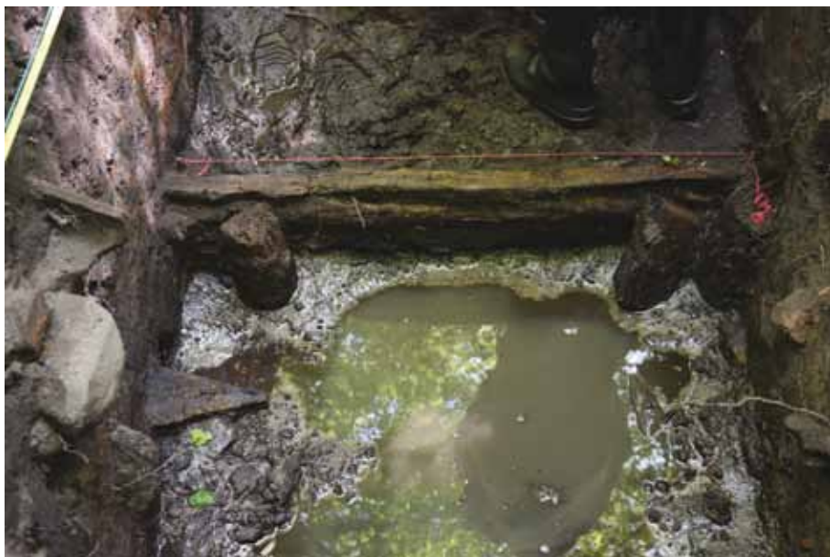
Abb. 5: Wall-Grabenbefestigung der Vorburg (Motte) mit Pfosten-Bohlenkonstruktion von 1375–1376 d

beiden von einem Querbalken geteilten Quitzow-Sterne. Vermutlich handelt es sich entweder um Nikolaus, einen der drei 1375 erwähnten Quitzow-Brüder auf Kletzke, oder um deren Vetter Klaus, der 1405 auch im Besitz der Burg Stavenow nachzuweisen ist. 157 Der Umstand, dass Klaus, der Sohn des Schwarzen Dietrich, weder 1375 noch 1404/05 mit dem Namen Nikolaus aufgeführt wurde, spricht allerdings für den Erstgenannten. Die zweite mittels Metalldetektor gefundene Petschaft ist nur fragmentarisch erhalten. Das lediglich zwei Zentimeter große Bruchstück gibt weder den vollständigen Namen noch das Wappen preis. Immerhin ist in der Umschrift der Vorname „ALART“ zu lesen, und dieser ungewöhnliche Name lässt sich im 14. und 15. Jahrhundert bei der Prignitzer Adelsfamilie von Rohr nachweisen. 158