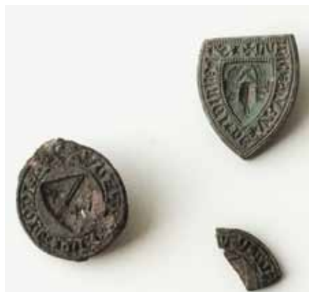
Abb. 4: Petschaften/Siegel [v. Quitzow, v. Falkenhayn, v. Rohr?] von der Turmhügelburg und dem Heerberg Kletzke (Aufnahme: Gordon Thalmann, 2023)