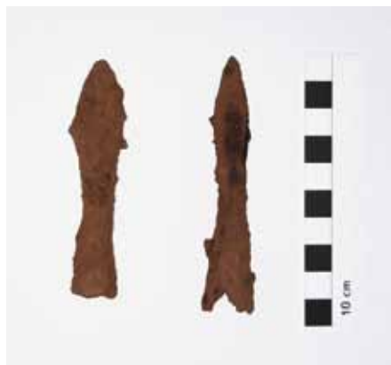
Abb. 3: Armbrustbolzen (Detektorfund) aus dem Wallkörper der Turmhügelburg Kletzke

Münzen lässt den Schluss zu, dass die Burganlage noch bis weit in das 15. Jahrhundert genutzt wurde. Bei den mittelalterlichen Militaria, die sich mit einer Ausnahme im Bereich der tiefer gelegenen Vorburg fanden, handelt es sich um zwei Steigbügel unterschiedlicher Form, zwei Trensenfragmente, mehrere Armbrustbolzenspitzen (Abb. 3), ein mögliches Fragment eines Körperpanzers und ein Teilstück einer Schwertklinge. 155 Auf dem flachen Plateau der Vorburg konnten ferner Gegenstände des alltäglichen Lebens, zum Beispiel zahlreiche handgeschmiedete Nägel, mehrere Schnallen und Haken, Messer und Messerteile (Klingen, Messerplättchen, Griffe) sowie eine Bügelschere aus dem Boden geborgen werden. Für einen gehobenen Lebensstandard sprechen zwei versilberte Messerscheidenbeschläge. Des Weiteren fanden sich noch einige Scherben harter grauer Irdenware des 13.–15. Jahrhunderts sowie Tierknochenfragmente mit Schnittspuren. Zu den herausragenden Metallfunden zählen zwei Petschaften (Siegel), die durch Detektorbegehung entdeckt wurden. 156 (Abb. 4) Bei dem ersten Siegel, das von der Hügelkuppe der Hauptburg stammt, handelt es sich um eine ca. vier Zentimeter große Petschaft. Im umlaufenden Perlenband lässt sich trotz starker partieller Korrosionsspuren der Name des Siegführers ★NICOLAI★DE★QUITZOW★ lesen. Das Wappenschild zeigt die