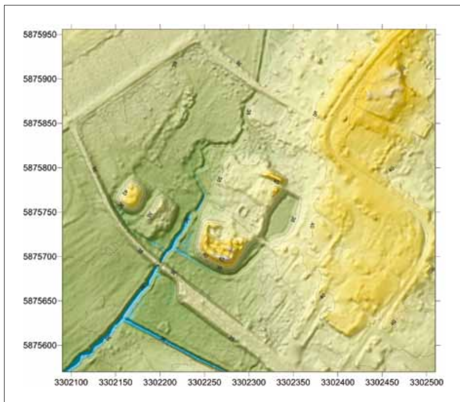
Abb. 2: Digitales Geländemodell (LGB) von der Doppelmotte und Burgruine Kletzke (Torsten Geue, 2023)

bruar/März und im Mai 2023 Funde an der mittelalterlichen Burg und auf dem nahe gelegenen Heerberg gemacht werden. 153